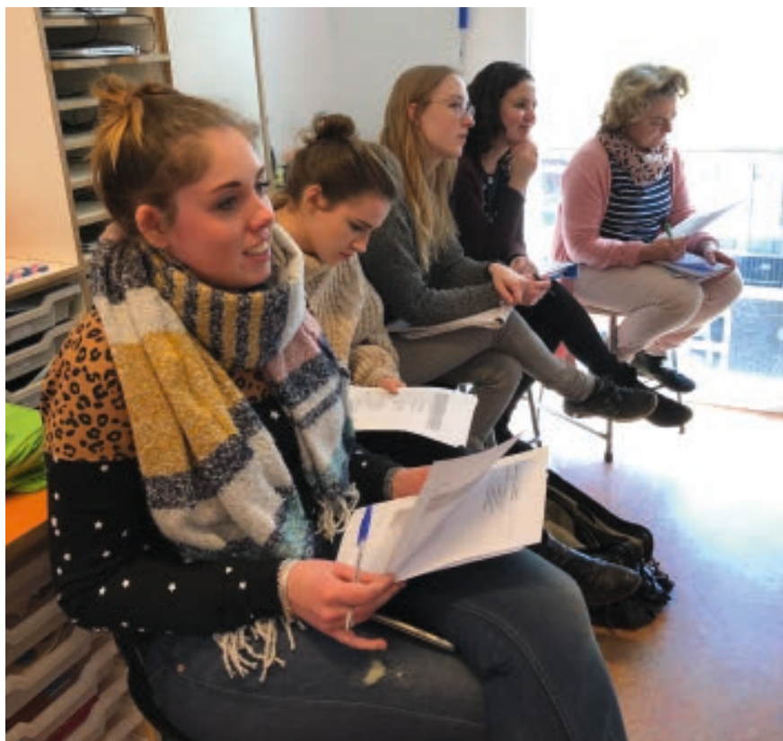
Collega's observeren achterin de klas de rekenles die gezamenlijk werd vormgegeven.

bewuste keus. 'Ook al had het team zelf aangegeven gezamenlijk lessen te willen gaan voorbereiden, bij de daadwerkelijke start van Lesson Study was er toch wel wat weerstand. Was het allemaal wel echt nodig? Het is al zo druk... Om die reden wilde ik juist met een groep leergerige, deels onervaren leerkrachten beginnen, die daarna ook de andere